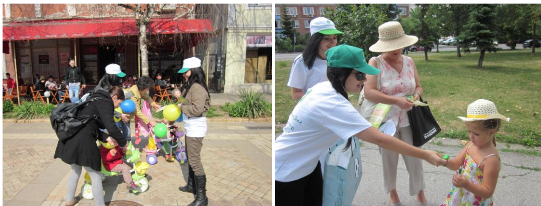
- Проект „Екоистично”

Акциите се проведоха в общините Елин Пелин и Горна Малина, и районите на Столична община, с които Булекопак АД има договор за изграждане на разделно събиране на отпадъци от опаковки (район Младост, район Искър и район Нови Искър). По време на реализирането им се разпространяваха информационни листовки и награди.